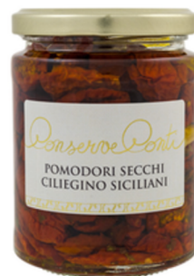
Conti - Kirschtomaten getrocknet Art. 161200