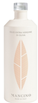
Mancino - Bio natives Olivenöl extra Art. 380825