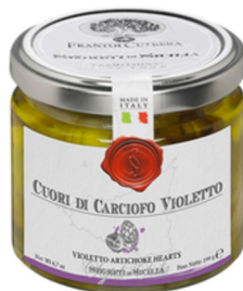
Frantoi Cutrera - Artischockenherzen Art. 882305